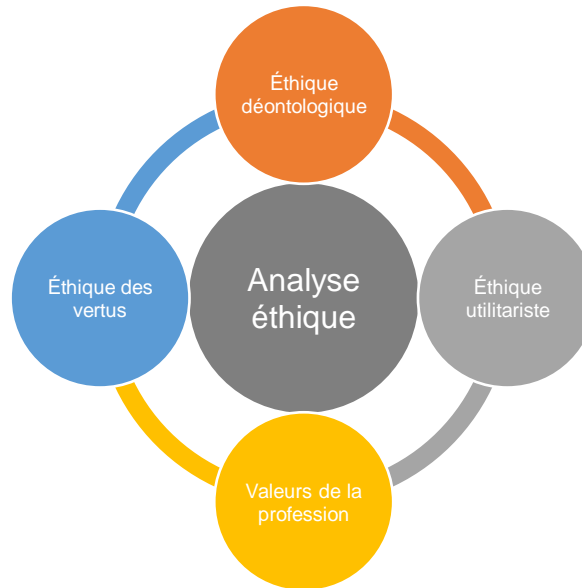
Figure 3 : Les quatre lunettes éthiques du Cadre éthique quadripartite

En quoi ces données sont-elles pertinentes et intéressantes d'un point de vue éthique? Cette section présente une réflexion sur ces données et leurs implications éthiques. À l'aide du Cadre éthique quadripartite [23], quatre analyses éthiques sont articulées (voir la Figure 3).