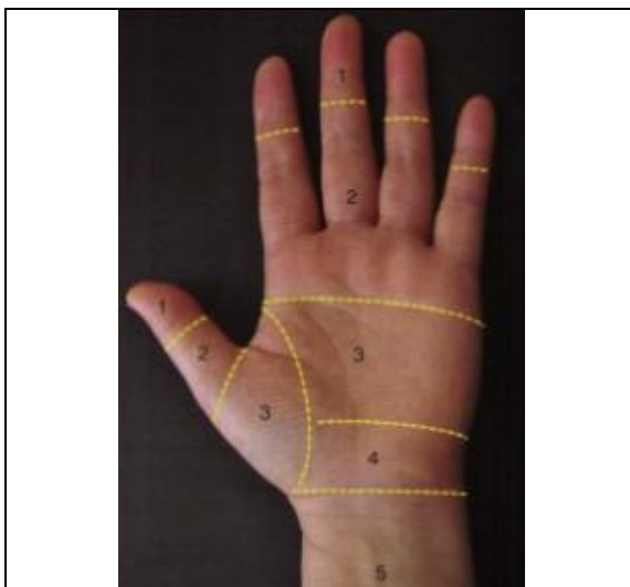
Figure 1 : Zones des tendons fléchisseurs de la main (Dubert, 2017)