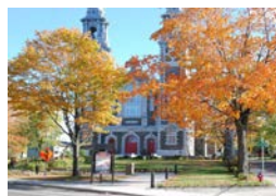
« On reconnaît Sainte-Croix grâce à l'église, les autres photos pourraient être partout »