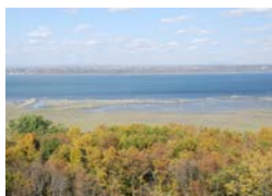
« Un paysage exclusif à Sainte-Croix »