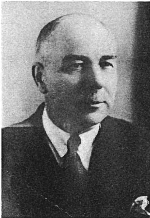
Figure 11: Beltez