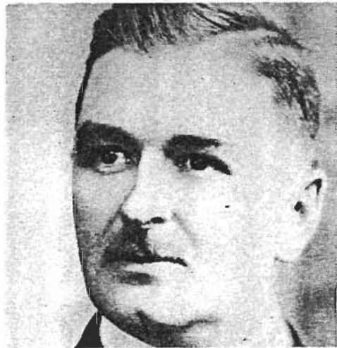
Figure 12: Duplessis