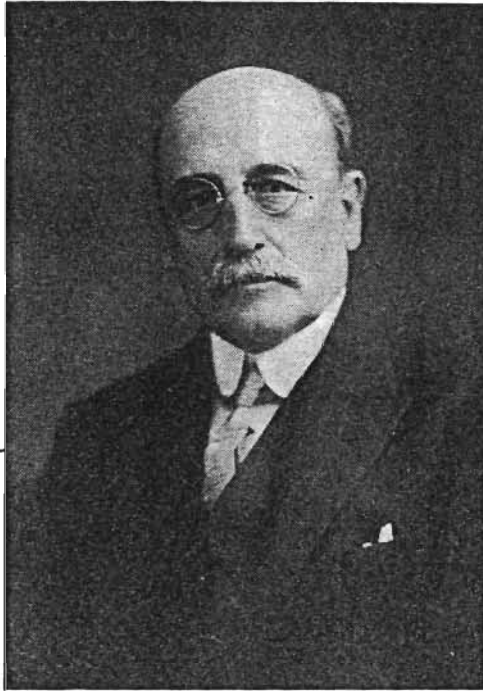
Figure 9: Bureau