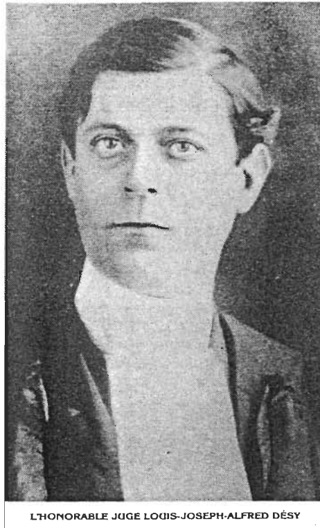
Figure 2: Désy

«Les saletés que l'enquête met à jour étalent devant la conscience publique des noms et des faits qui ne sont pas à l'honneur de notre cité».