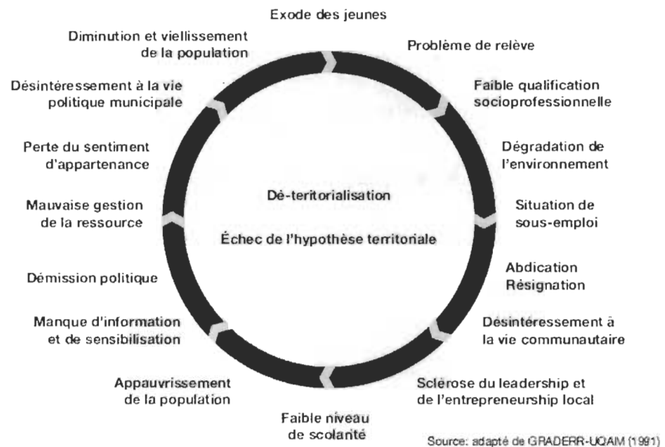
Figure 1. Cercle de la dévitalisation territoriale (MAMOT, 2010, p. 11)

Ces facteurs de la dévitalisation revêtent dans bien des cas une double casquette, en apparaissant comme une cause dans un premier temps, puis comme une conséquence dans un deuxième temps. En effet, le ministère des Affaires municipales et de l'Occupation du territoire (MAMOT) précise que le processus de dévitalisation est global et intégrant ; c'est ainsi qu'il explique